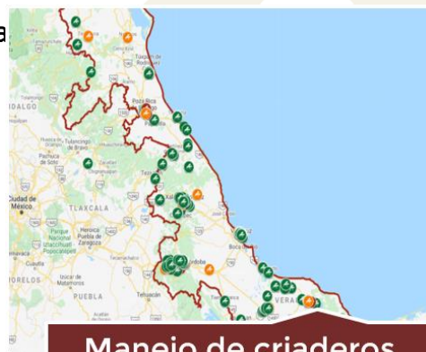
Manejo de criaderos del mosquito transmisor del Dengue